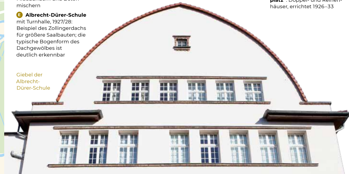
Giebel der Albrecht-Dürer-Schule

10 Siedlung „Exerzierplatz“: Doppel- und Reihenhäuser, errichtet 1926–33