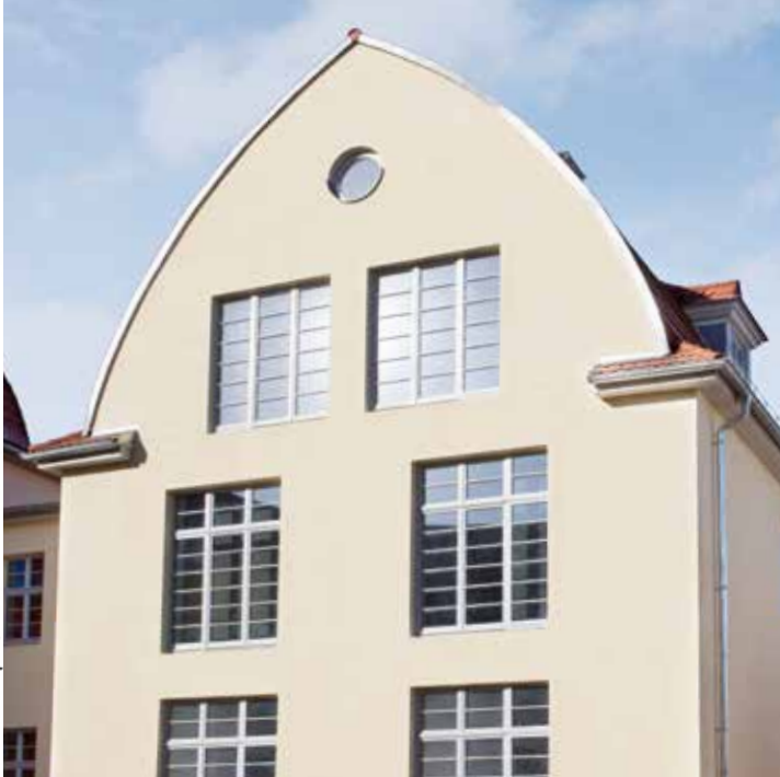
Ehemaliges Gesundheitsamt Christianenstraße (C)