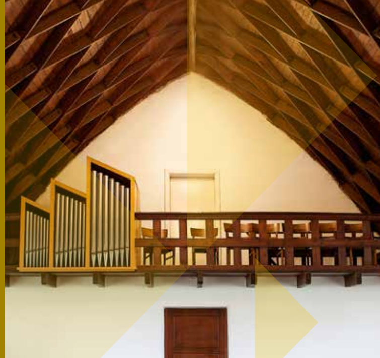
Holzkonstruktion in der Freiimfelder Kreuzkapelle

Entdecken Sie hier den Meister der Dächer. Entdecken Sie einen Kulturschatz Merseburgs. Besuchen Sie uns im Zollinger-Jahr 2019!